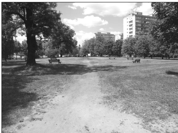
Fot. 1. Widok pustej przestrzeni wewnątrz placu skrywającego pod ziemią fundamenty kościoła.

Photo 1. A view of empty space inside the square hiding the church's foundations under the ground.