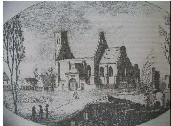
Ryc. 3. Widok na kościół po spaleniu przez wojska pruskie. Lata 1806-1830.

Fig. 2. A view of the third of St. Nicholas' churches. Year 1763. Source: Wratislaviae Amici – dolny.slask.org.pl.