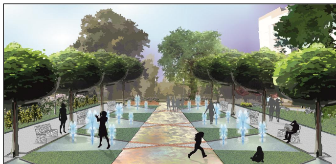
Fig. 5. A view of square's floor with fountains based on the last church's plan.

Ryc. 6. Widok na odsłonięty fragment podziemi oraz na symboliczny krzyż w miejscu ołtarza.