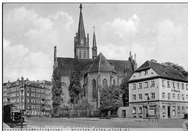
Fot. 3. Krajobraz placu z kościołem.

Ceglana neogotycka budowla prezentowała się jako majestatyczna dominanta architektoniczna w tej części dzielnicy (fot. 3). W krajobrazie Szczepina była to druga, po kościele św. Pawła, dominanta przestrzenna górująca nad całą okoliczną zabudową.