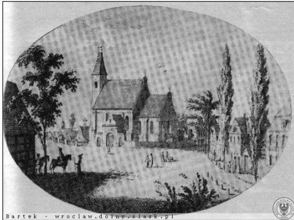
Ryc. 2. Widok trzeciego kościoła św. Mikołaja. Rok 1763.

Fig. 2. A view of the third of St. Nicholas' churches. Year 1763.