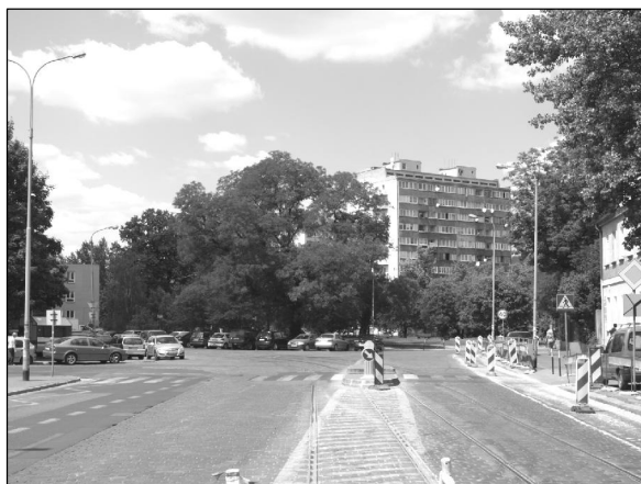
Fot. 2. Obecny krajobraz placu. Widok z 2012 roku.

Photo 1. A view of empty space inside the square hiding the church's foundations under the ground.