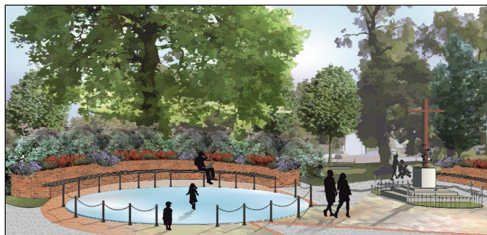
Fig. 6. A view of exposed basement's fragment and symbolic cross in altar place.